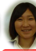
2歳児 イルカ組担任