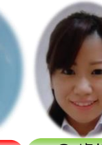
3歳児 パンダ組担任