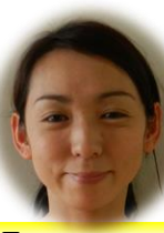
4歳児 キリン組担任