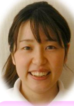
0歳児 ラッコ組担任